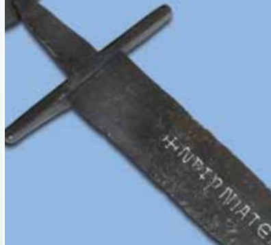
o spada ca nel 1200