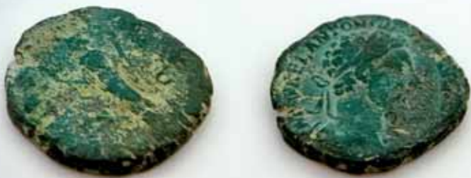
o Sesterzi romani 177 - 179 dopo Cristo