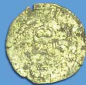
o Meraner Vierer 1427 - 39