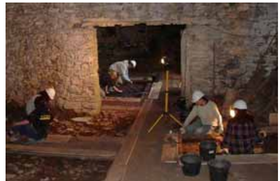
Abb.: archäologische Untersuchungen in der Naturhöhle