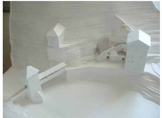
Abb.: Foto - Modell Altfinstermünz im Bereich der Vorbauten