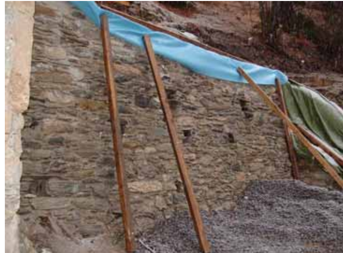
Abb. Südl. Vorbauten nach archäol. Untersuchung und Mauerwerksrestaurierung