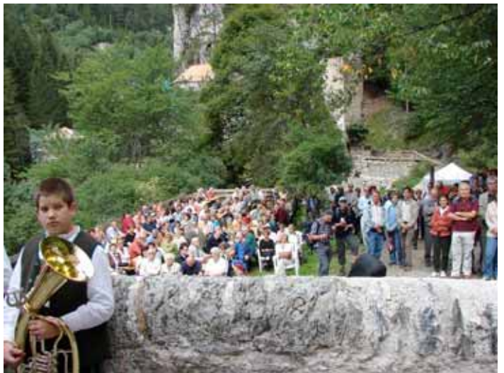
Abb.: Altar- und Kapelleneinweihung von Erzbischof W. Haas (Chur/Liechtenstein)