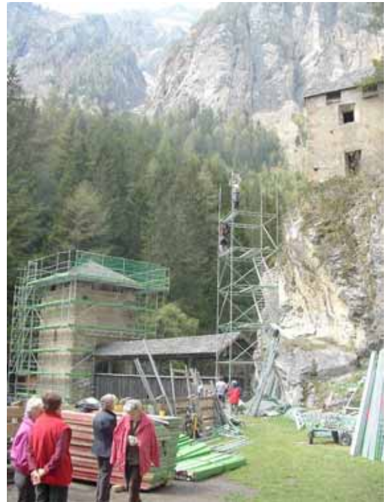
Abb.: Brückensanierung und Sanierung Sigmundseck