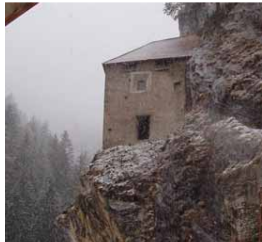
Abb.: Sigmundseck Winter 05 und Winter 06