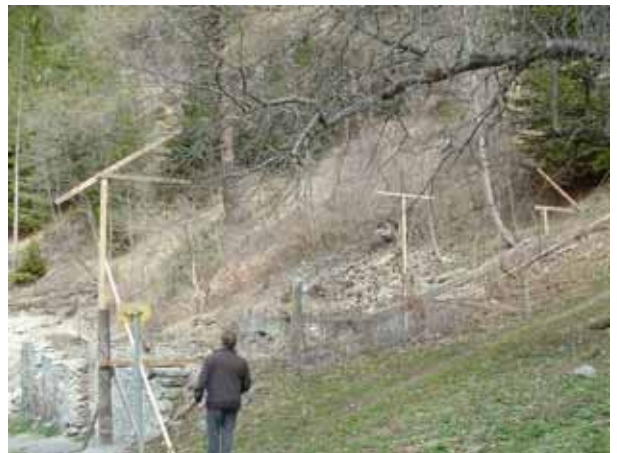
Abb.: Stangehilfskonstruktion im Bereich Wirtschaftsgebäude-Stadel