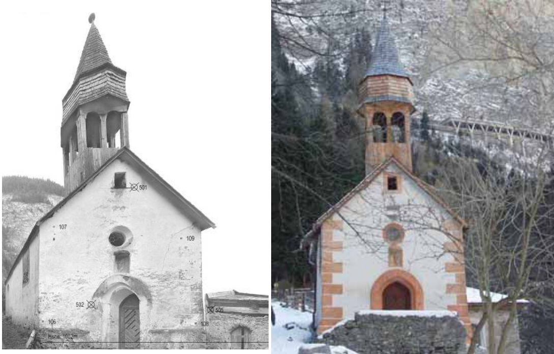
Abb.: Kapelle vor und nach der Außensanierung